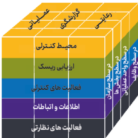
شکل ۱: چارچوب یکپارچه COSO 2013

هنگامی که سازمانی استفاده از بلاکچین را از طریق لنز COSO ارزیابی می‌کند، هیئت مدیره و مدیران ارشد را قادر می‌سازد تا زمینه را بهتر بشناسند و ارزیابی‌های آگاهانه‌تری از پتانسیل و کاربرد فناوری با توجه به کنترل داخلی انجام دهند. این سازمان را قادر می‌سازد تا تجزیه و تحلیل دقیق ریسک را انجام دهد و به نوبه خود، فعالیت‌های کنترلی مناسب برای مقابله با چنین ریسک‌هایی را توسعه دهد، و استفاده مؤثر از بلاک چین را تسهیل می‌کند.